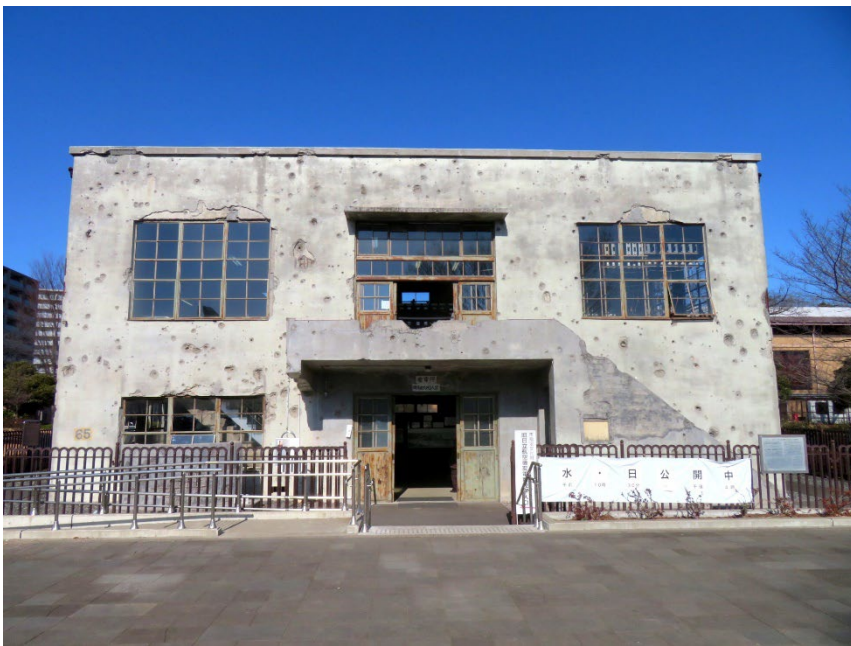
機銃掃射の跡が無数に残っています