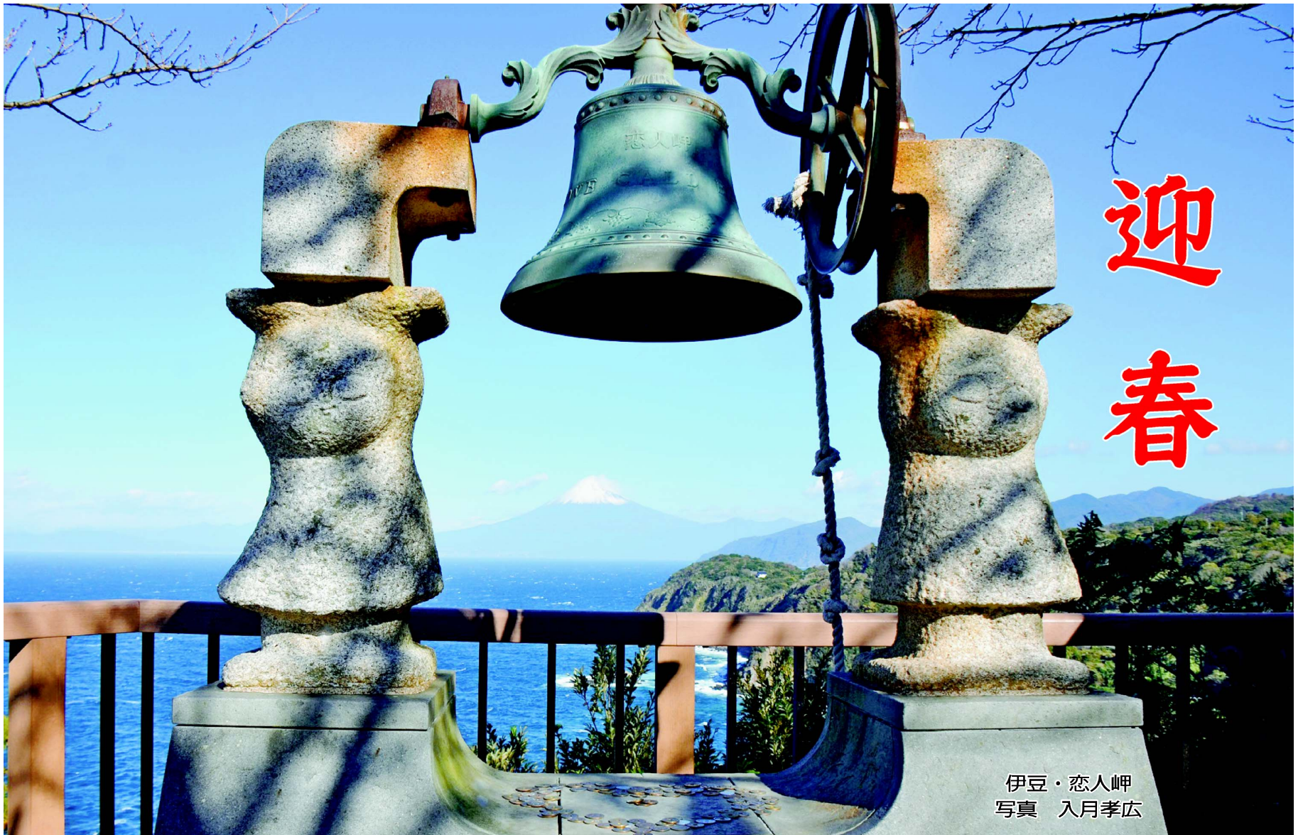
伊豆・恋人岬

東京葛飾医療生活協同組合 〒125-0063 葛飾区白鳥2-3-6 ☎(5680)7166 FAX(5680)7167 下千葉診療所 ☎3602-2254 コープ訪問看護ステーション ☎3690-7112 篠原診療所 ☎3697-0765 コープ訪問看護ステーション サテライトかなまち ☎3609-3060 金町診療所 ☎3607-5124 ヘルパーステーション虹の輪 ☎5629-7229 居宅介護支援事業所「ほりきり」 ☎3690-2080