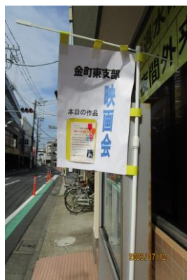
当日は、この旗が目印