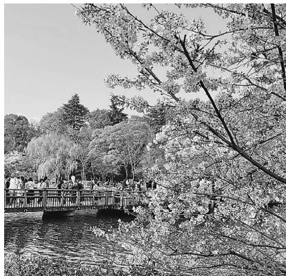
桜満開の井の頭公園

てきたので外出とか、旅行に行きたいし、友達とも会いたいと思っております。今後ともよろしくお願ひします。