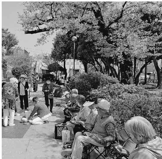
青戸平和公園で亀青支部

1つ葛飾白鳥店へ。レジ で「お花見ですか」と職 員から声をかけられる。 12時を前に次々、組合 員さんが集まり、初めて 参加した組合員さんも 「花びらの舞い散る下で お弁当をたべるのも楽し いね」と感想を述べてい ました。