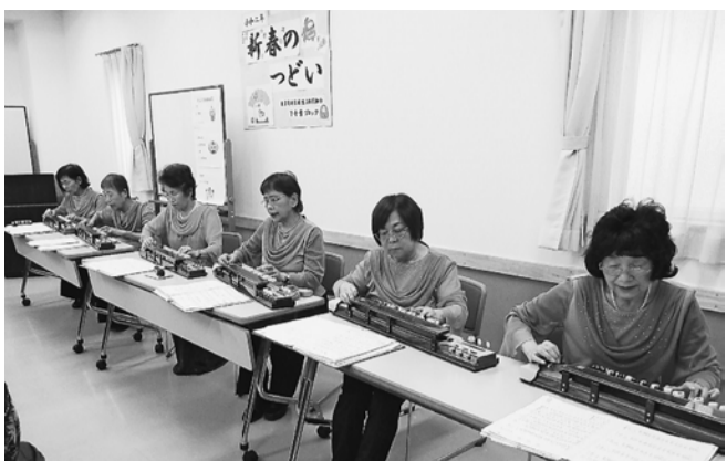
息の合った大正琴の演奏