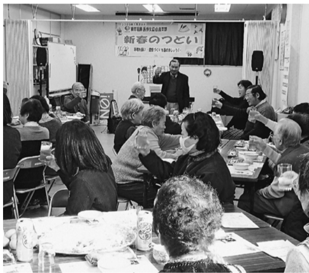
カンパイする白鳥支部