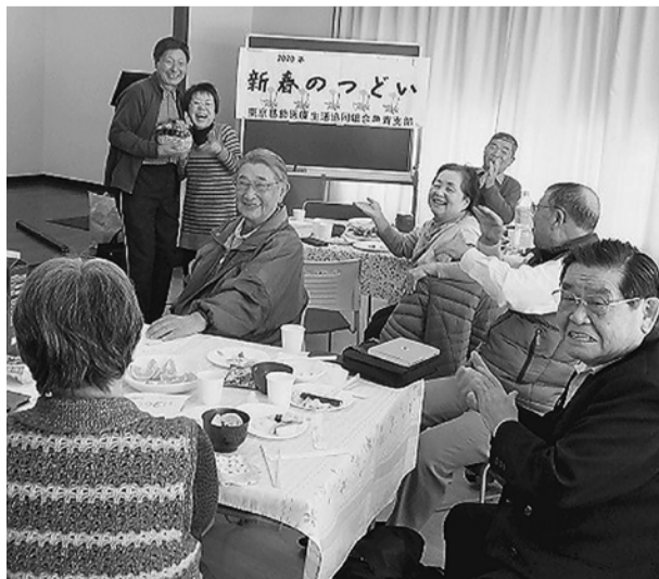
今年山で健康づくり 2月2日 亀青支部