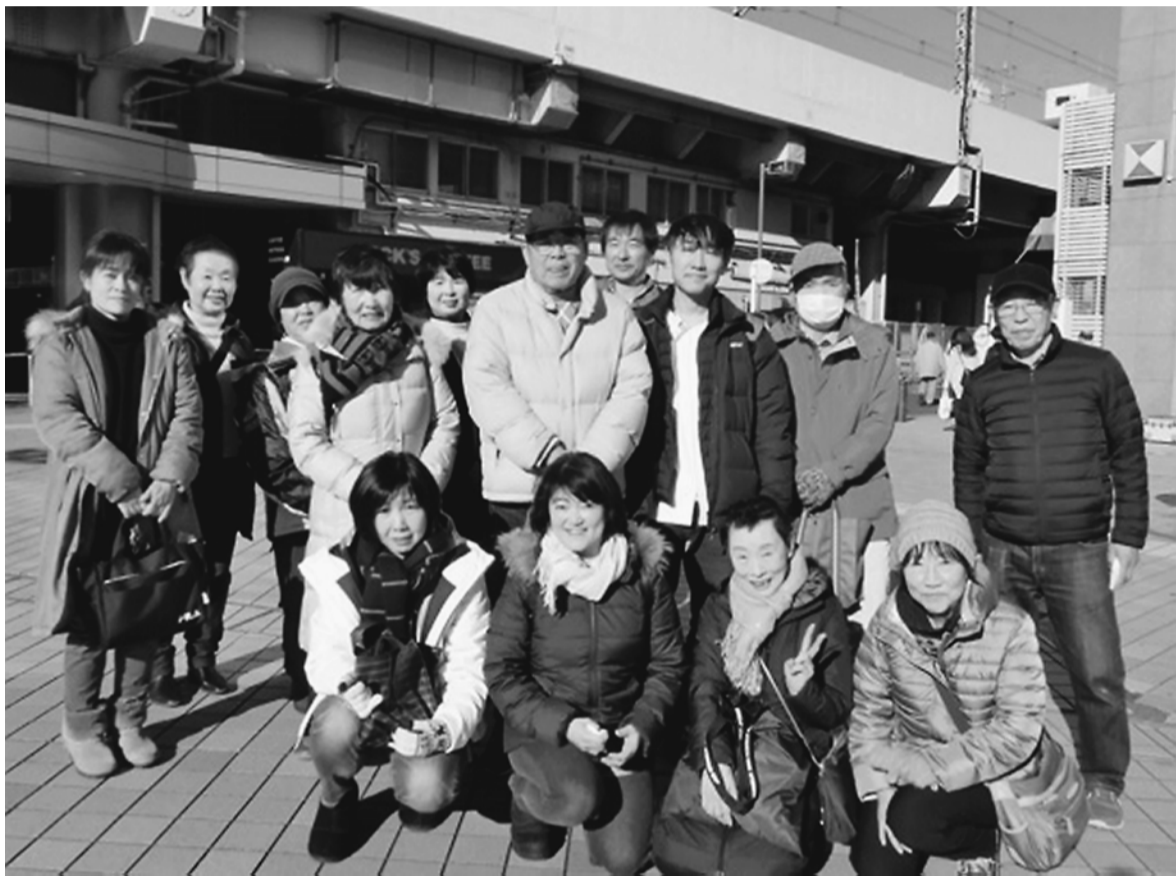
チラシが飛ばされるハプニングがありました