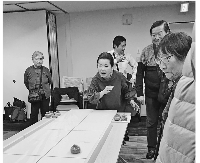
カールトを楽しむ参加者