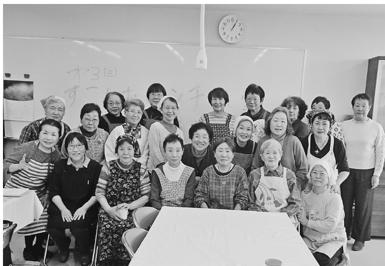
3月19日楽しくお料理しました

健康づくり委員会では、今年も「すこしおランチ会」を企画しました。会場は、亀有学び交流館の料理実習室。初め