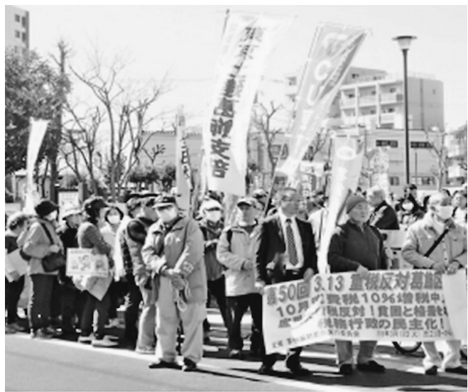
葛飾税務署に向かい集団申告しました

去る3月13日に開催された「消費税10%ストップ・重税反対葛飾区民集会」は今回で50回目