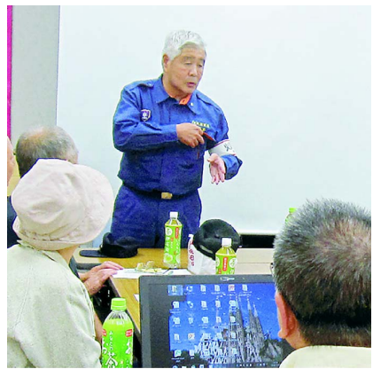
ふさのつづ学習会

【正常性バイアス】と は異常事態に遭遇したと き「こんなはずはないこ れは正常なのだ」と自分