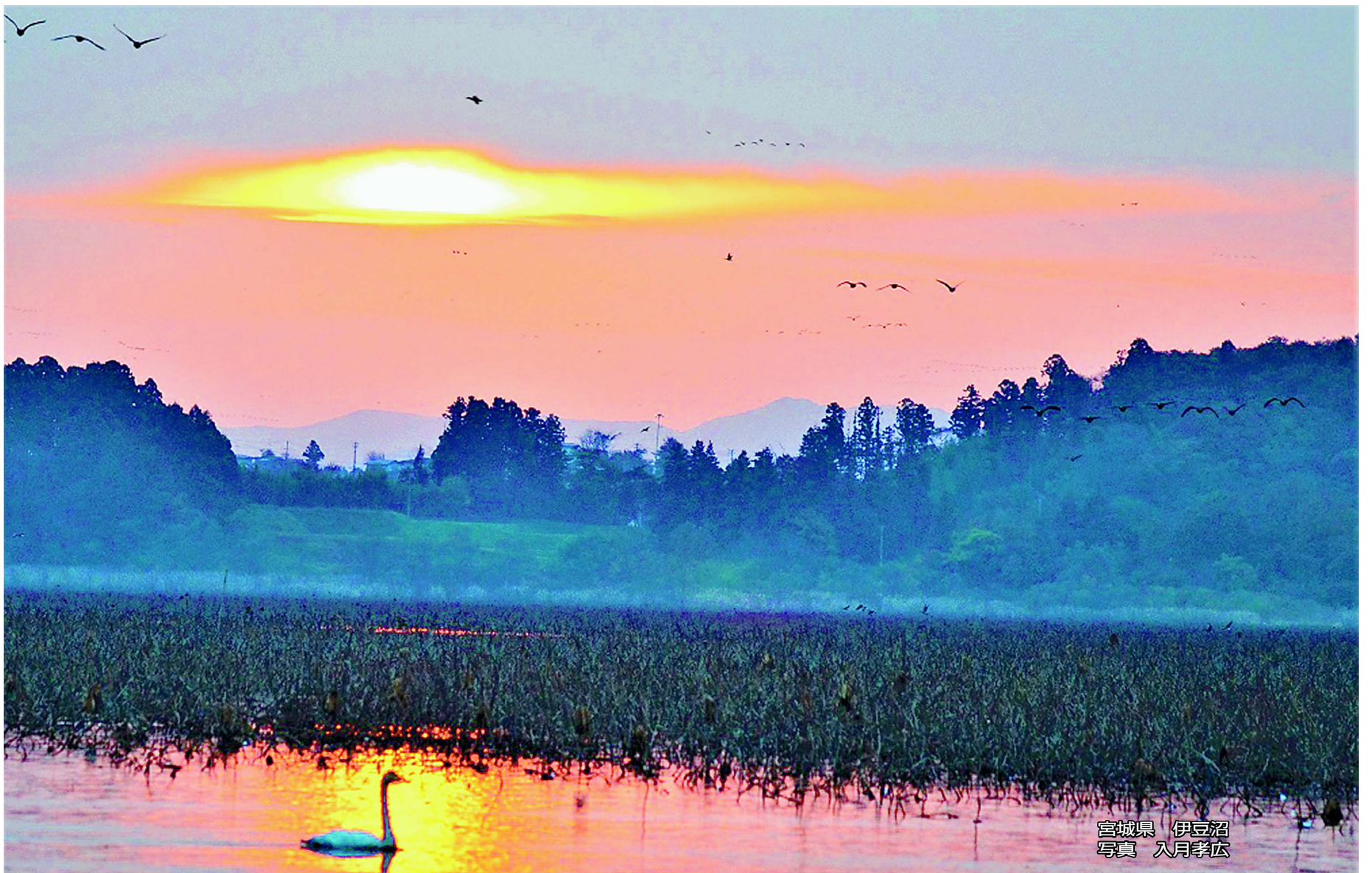
宮城県 伊豆沼