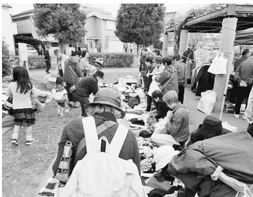
中からは掘り出し物

11月4日(日)に曳舟川親水公園で行われた「民商まつり」は時々小雨がぱらつく事はありませんでしたが本降りにはならず無事最後まで行うことができました。 出来ました。ステーションではフラダンス、エイサーや落語、最後はお米や特産品などが当たる楽しい抽選会が行われました。