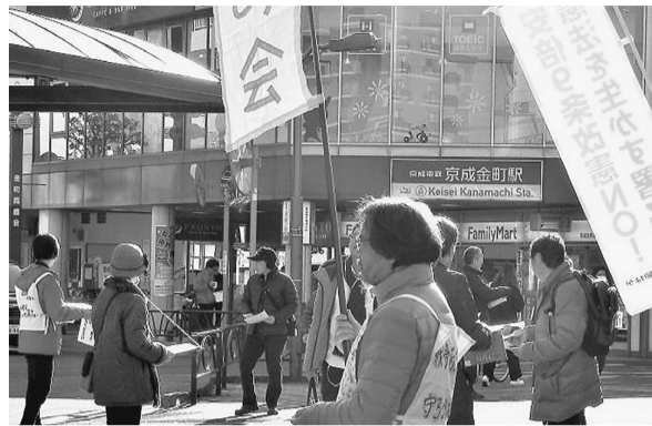
1月13日、57筆集まりました

安倍首相は「自衛隊を明記するだけで何も変わらない」と言っています。が「何も変わらない」ならば変える必要はありません。この間アベ政権はこれまでの政府見解を覆して、集団的自衛権を容認し安保関連法（戦争法）を強行採決、共謀罪法も強行しました、総仕上げは憲法9条に自衛隊を戦力として書きこみアメリカの要求にこたえ集 团的自衛権を理由に海外での戦争に加担できるようにすることです。このような憲法破壊は断じて許されません。何としても憲法9条を守り抜こうと葛飾区内の9条の会や改憲に反対する人たちで「アベ改憲に反対する共同行動」を始めました。 葛生協では「9の日行動」を提起し9、19、29日にお花茶屋駅で午後4時から5時まで署名行動を行っています。是非署名にご協力ください。そして署名行動にご参加ください。 社保平和委員会 入月 孝広