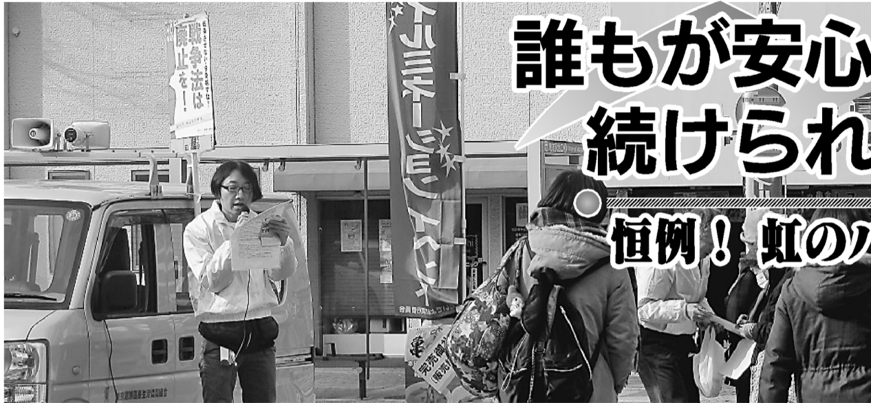
菅野金町診療所事務長

東京葛飾医療生活協同組合 〒125-0063 葛飾区白鳥2-3-6 ☎(5680)7166 FAX(5680)7167 ほりきり訪問看護ステーション ☎3690-7112 かなまち訪問看護ステーション ☎3609-3060 ヘルパーステーション虹の輪 ☎5629-7229 居宅介護支援事業所「ほりきり」 ☎3690-2080