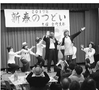
金町ブロック 診療所職員