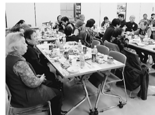
下千葉ブロックの皆さん