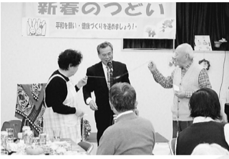
白鳥支部 マジックショー