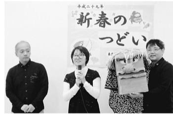
下千葉ブロック 獅子舞

力者がペアになった組合員訪問、事業所利用者の未加入者訪問、地域訪問、高齢者見守り活動、認知症サポーター養成講座の全地区の継続的開催など、各支部運営委員会や班を中心にした組合員活動をすすめていきます。