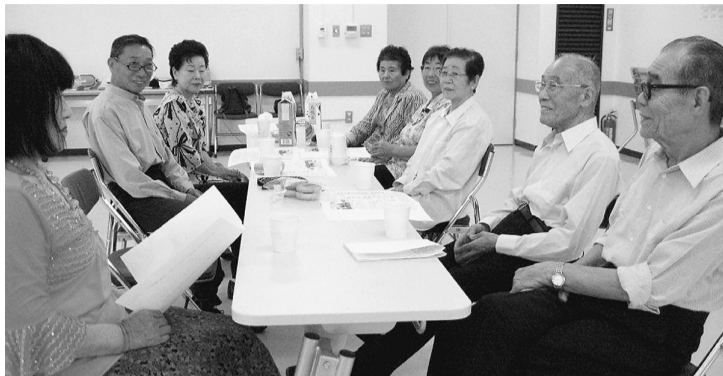
脳トレ中のダンス班

ダンス班は10年続くサークル班です。レッスンを始める前に血圧チェックを行い、テキストを使って疾患の理解や予防について学習をしたり、地図当てクイズ、川柳やエッセイの音読等の脳トレを行っています。