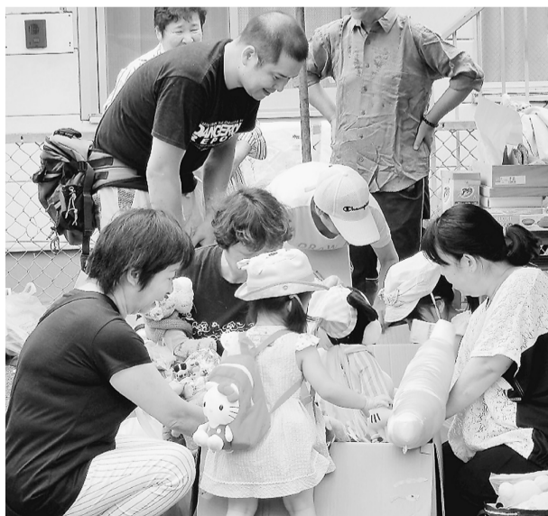
下千葉診療所駐車場の様子