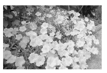
皆さんを出迎えています