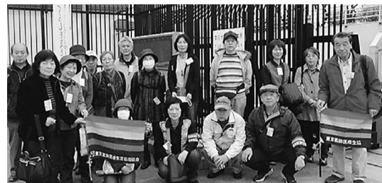
金町浄水場の前で

3月23日金町地域歩こう会では、「金町浄水場」の見学を20名の参加で行いました。 浄水場の飲料水の説明の後、屋上から浄水場全体を見渡し、場内へ。金町浄水場は100%高度