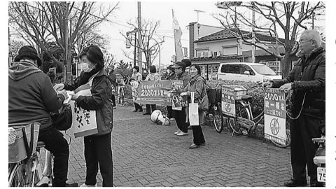
水元公園前で署名活動