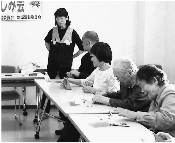
折紙細工をする参加者

「なかなか上手くいかないわ」「昔はもっと器用だったのよ」と会場に笑い声が広がります。