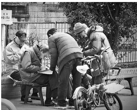
宣伝カーの呼びかけで署名に協力してくれました

1人ではなく2人での訪問は元気が出て会話もはずみます。戦争法の廃止を求める署名は、これからも組合