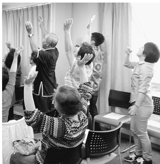
体を伸ばしたり、笑ったり

「より良い介護・医療 をめざす水元ふれあいネ ットワーク」主催の健康 まつりに参加してしまし た。