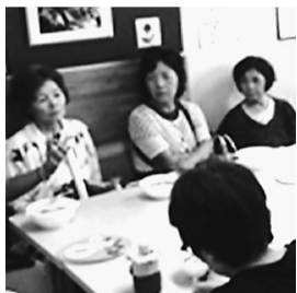
7月25日、18名参加した 篠原支部