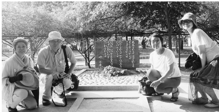
味三吉詩碑の前で

被爆70年・戦後70年の節目の今年、広島、長崎両市で世界大会が行われました。葛飾代表団は21名、葛生協から3名が参加しました。夜遅くまで続き、灯籠の数は一万个だったそうで、ライトアップされた原爆ドームの前をゆっくり流れる灯籠の灯りは、被爆した人々の苦しみを癒すように、あなたに、あたたかく、幻想的で、一緒に参加した若い女性性が、「平和っていいな、平和じゃないところなん事でよねー」としみじみと言った言葉が胸に響きました。7日は