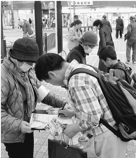
親子で署名をする方も

東京葛飾医療生活協同組合 〒125-0063 葛飾区白鳥2-3-6 ☎(5680)7166 FAX(5680)7167 下千葉診療所 ☎3602-2254 篠原診療所 ☎3697-0765 金町診療所 ☎3607-5124 ほりきり訪問看護ステーション ☎3690-7112 かなまち訪問看護ステーション ☎3609-3060 ヘルパーステーション虹の輪 ☎5629-7229 居宅介護支援事業所「ほりきり」 ☎3690-2080