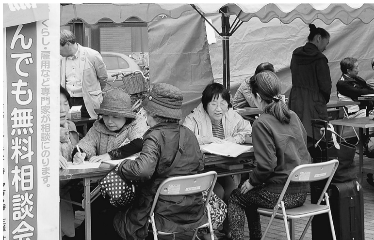
亀有リリオパークには4張のテントをはり、即席の相談会場が つくられました。