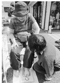
足指力測定もしました

コープみらい亀有店は年3回フリーマーケットを計画しています。亀青支部では3月28日にも健康チェックで参加しました。暖かい春の陽気に恵まれ12店舗が出店し、100人以上が参加しました。健康チェックでは27人が測定を行いました。今回は足指力測定器も持