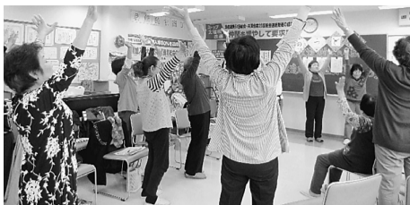
みんなで笑いケア体操 (民商婦人部)

4.7 WHO世界保健デーにも呼応して 前に各地の健康づくり活動に参加しています。 フリーマーケットで