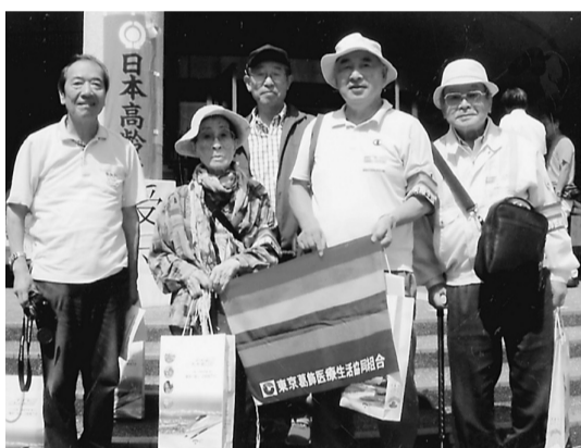
富山大会に参加した代表团

大会を契機に葛飾区でもよりいっそう高齢期運動を広げようとして話し合います。東京葛飾医療生協と年金者組合が中心となって区