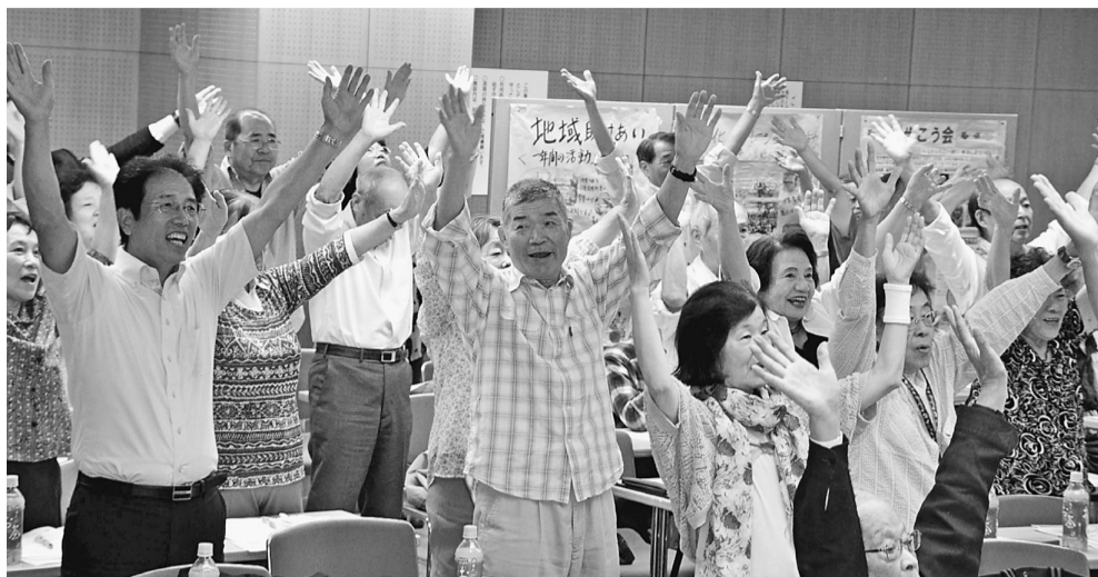
「笑いケア体操」で会場が笑いに包まれました

東京葛飾医療生活協同組合 〒125-0063 葛飾区白鳥2-3-6 ☎(5680)7166 FAX(5680)7167 ほりきり訪問看護ステーション ☎3690-7112 下千葉診療所 ☎3690-7112 ☎3602-2254 かなまち訪問看護ステーション ☎3609-3060 篠原診療所 ☎3697-0765 ヘルパーステーション虹の輪 ☎5629-7229 金町診療所 ☎3607-5124 居宅介護支援事業所「ほりきり」 ☎3690-2080