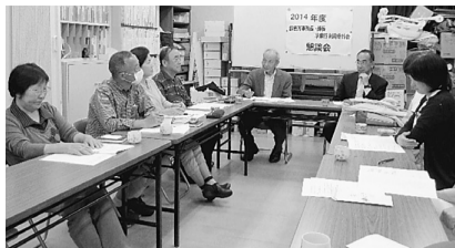
懇談会を行いました

聴き取りに關してです。「職員が親切」「先生の診察が的確」「送迎がありがたい」など診療所に対する信頼や感謝が厚い中で、「夜間診療を増やしてほしい」「受付開始のときに待機していた順番が乱れる」「ポットに温かいお茶があるが冷水も欲しい」「トイレの壁が汚れている」などの苦情がありました。懇談では、すぐにできることやこれから十分に検討すべきことなどを話し合いました。