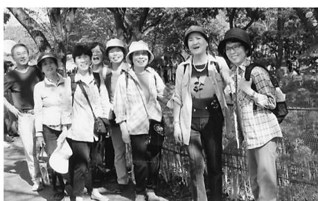
曼珠沙華をバックに

9月21日、満開の曼珠沙華が咲き誇る中着田を歩いてきました。秋晴れのさわやかな日和にめぐまれ、池袋から西武池袋線で高麗駅で降り、15分ほどで中着田曼珠沙華公