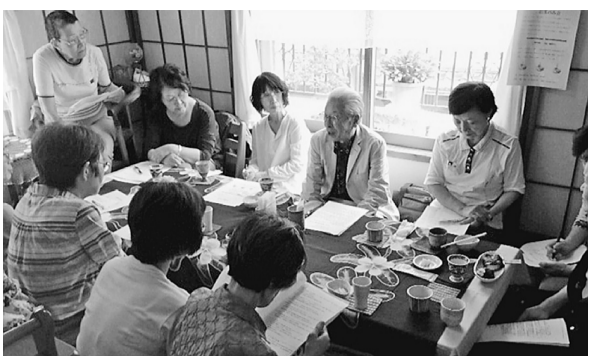
話はずんだお茶のみ会