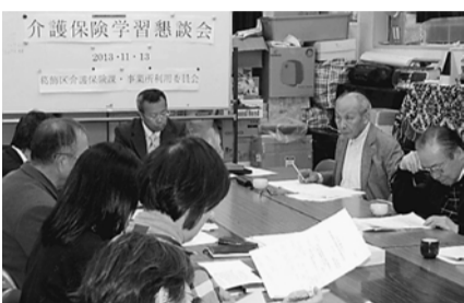
介護保険学習懇談会

り看護ステーションの看護師の皆様にも支えられ感謝しております。なくなつてこの1月末で2年目になりました。加入したのは、なくなつた母が2005年の暮れに倒れた結果、腰の骨折となり、介護が始まりました。年明けからこの病院が良いのか悩みを抱えて探歩き、診療科目が多