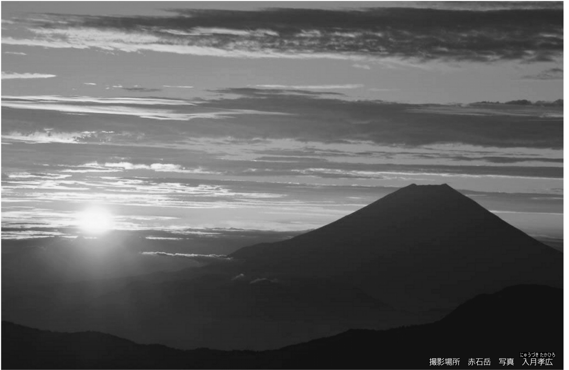
撮影場所 赤石岳

東京葛飾医療生活協同組合 〒125-0063 葛飾区白鳥2-3-6 ☎(5680)7166 FAX(5680)7167 下千葉診療所 ☎3602-2254 篠原診療所 ☎3697-0765 金町診療所 ☎3607-5124 ほりきり訪問看護ステーション ☎3690-7112 かなまち訪問看護ステーション ☎3609-3060 ヘルパーステーション虹の輪 ☎5629-7229 居宅介護支援事業所「ほりきり」 ☎3690-2080