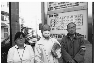
今から訪問に行ってきます

10月に外来患者未加入の方に「加入訴えと医療生協パンフレット」を郵送。11月20日、午後3時から職員と運営委員がペアになり、訪問行動を行いました。