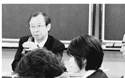
熱心に話を聞く職員