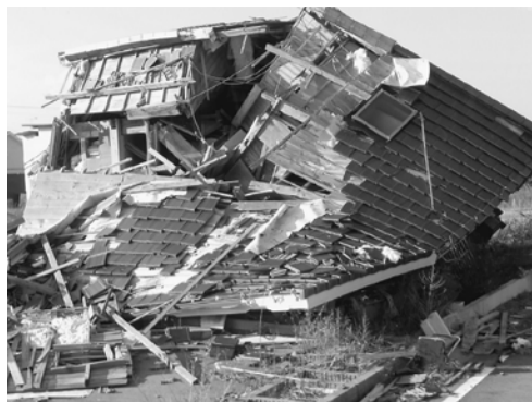
崩壊したままの民家