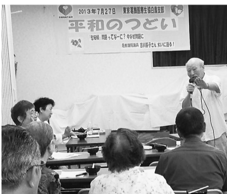
白鳥支部の「平和のつどい」

今年も各支部で「平和のつどい」が開催されています。篠原支部ではビデオ映画を鑑賞した後すいとんを食べながら語り合いました。