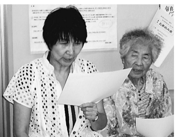
みんなでハーモニカ伴奏にあわせて合唄

毎月最終土曜日、午後2時〜4時まで、お茶やお菓子を食べながら和やかに始めます。参加費は