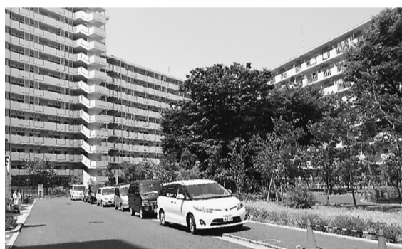
新宿6丁目にある「さつき団地」

新宿さつき団地は、昭和三十年代に建設された、古い都営住宅です。近年建て替えられて、高層化した5棟には、約800世帯の方が住んでいます。多くは高齢者世帯で、ひとり暮らしの方も多いようです。