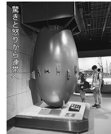
模型は実物大の原爆

非必要です。開会式、分科会、閉会総会に参加し、原水協に出るのだと聞いて実に頼もしく思いました。疲れないう若い世代が羨ましい。代表派遣に際し、多くの組合員さんから多額の募金を頂きありがとうございました。