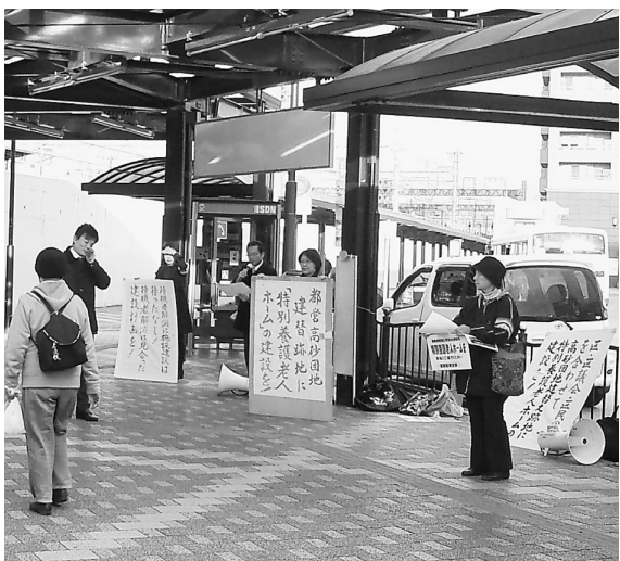
1時間で137筆の署名が寄せられました

「葛飾は特養ホームが少ないわね、ぜひ実現させて」2月4日、金町駅南口で高砂団地建替