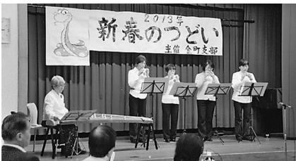
金町ブロック新春のつどい

「葛飾は特養ホームが少ないわね、ぜひ実現させて」2月4日、金町駅南口で高砂団地建替