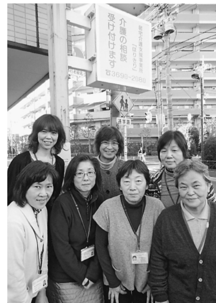
気軽にご相談下さい

介護保険が平成12年に開始した時、東京葛飾区療生協は訪問看護師がケアマネを兼務して開始しました。制度の改定が進むうちに、訪問看護とケアマネを兼務することが難しくなりました。そこで他職種も入れてケアマネの専任化を進めてきました。