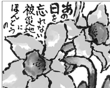
飛んで 跳ねて 自分らしく 一年に