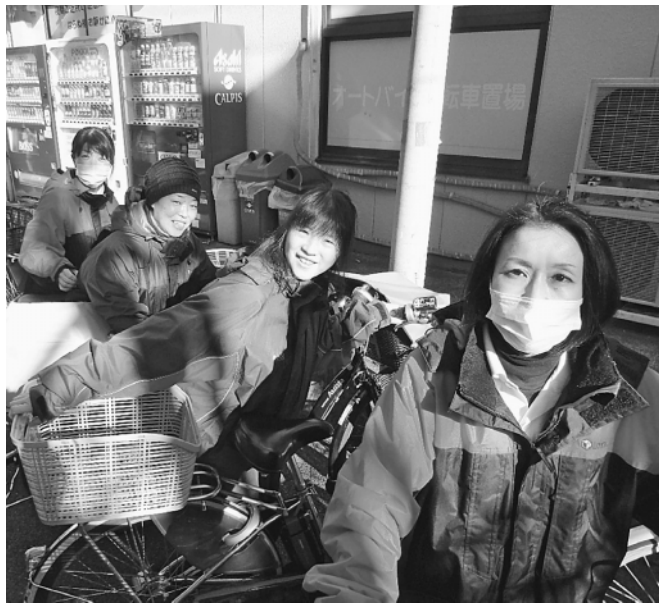
これから元気に行ってきます