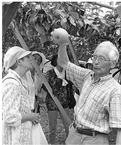
今年の梨はおいしく実のりしました