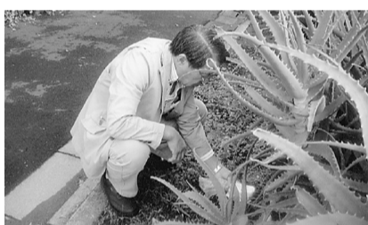
非常に高い放射線量が