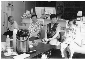
診療所の待合室で