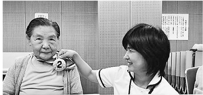
メダルをかけてはいポーズ

まだまだ暑さの続く 9月12日(水)。四つ 木地区センターで「し のはら敬老のつどい」 を行いました。