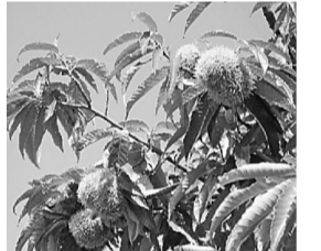
くりごはんでいただきました

当日は台風が近づいており、天候は不安定でしたが、茨城(筑波)に梨狩りと栗拾いに43名が参加しました。