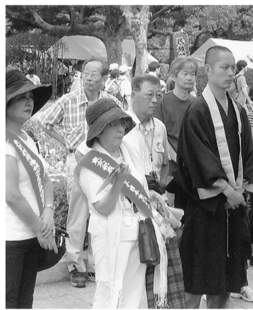
「葛友会」による献水式に参加

非常に短い日数でしたが、原発ドーム、資料館などを目のあたりにして、核兵器の恐ろしさ、悲惨さを改めて感じました。 それは核兵器と人類は決して共存はできないこと。平和祈年式の「子ども代表の平和の誓い」の中で、福島原発事故によって故郷を