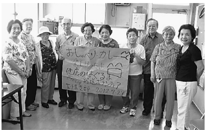
下千葉支部では、組

変わり。「二人暮らしで、一人暮らしの世話に でこんなおいしいカレー は久しぶり！」と思 わず笑顔に。 そして、話しが介護 保険料、消費税増税に 及び、「今までつま ま