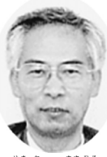
金町診療所・所長