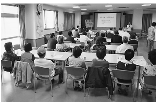
6月3日金町南支部が結成しました

講話会を持つことにしました。6月13日、かがやけ第2作業所の食堂をお借りし、35人もが参加しました。お話しは「治る老衰、治る認知症」というテーマでした。認知症が進行したような症状の患者の家族17人から相談を受け診察。その結果6人は甲状腺ホルモンの不足による症状であることがわかり、薬で劇的に治ったという例をあげて話されました。