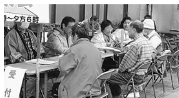
（みなさんの相談を受けた、何でも相談会4月19日開催）

6月に入って国民保険の保険料の納付書、住民税の納付書、介護保険の保険料の通知書が次々送られてきました。国民保険料では1人世帯（年金収入200万円）は2010年との対比で36,000円の値上げです。4人世帯（給与収入250万円）は2010年との対比で102,000円の値上げです。これは、昨年実施された算定基準の変更が大きく影響したものです。多世帯や障害者を抱えたご家庭ではもっと大幅に値上げされています。しかも来年には大幅な値上げ（1.5倍以上）の世帯には緩和措置がなくなり、より大きな値上げとなります。