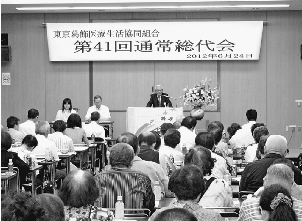
東京葛飾医療生活協同組合 第41回通常総代会 2012年6月24日

2012年6月24日(日)、国立区勤労福祉会館にて、総代総数130名のうち129名(本人出席110名、書面議決19名)の出席で開催されました。2011年度事業報告、決算報告・損失処理案、2012年度事業計画及び予算が全会一致で可決され、新たな役員体制が決まりました。 2011年度は経営再建初年度の目標を全役職員の奮闘で達成し、「葛生協の経営再建の転換点にでき今後の前進の重要な足がかりを築いた年」にすることができました。生協強化月間の成功をめざす「せーの集会」の開催、「健康のはぐるま」の手配り協力者増やし、仲間増やしや増資、健康づくり、社保平和活動、地域助け合い活動、事業所利用委員会活動、文化レクリエーション活動、環境を守る活動、新支部づくり