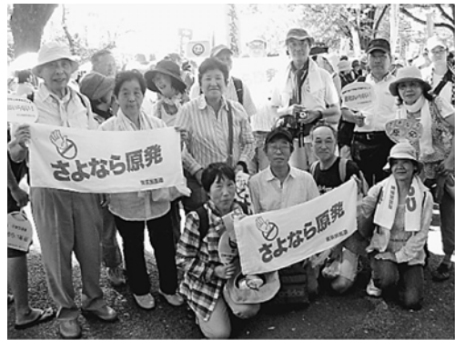
葛生協の仲間たち

感の声。熟年世代から子連れの若いお父さんお母さん世代、学生や若者といった多くの世代の方々が参加し会場は熱気にあふれていました。1時30分発のパレードも葛飾からの参加者は5時10分に出発。歩道を行き交う歩行者もシュプレヒコ