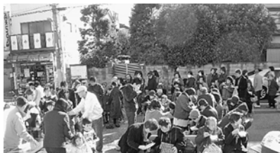
老いも若きも大勢参加(下千葉支部)

昨年12月18日(日)、診療所の駐輪場で恒例のお餅つきを行いました。きな粉、あんこ、からみの3種類を用意。