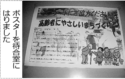
ポスターを待合室に はりました