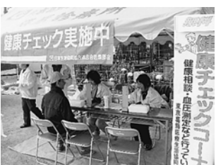
好評だった健康チェック

昨年11月20日（日）午前10～午後2時、東京土建葛飾支部「秋の住宅まつり」が開催されました。葛生協は健康相談や健康チェック（血圧測定・体脂肪測定）を行いました。