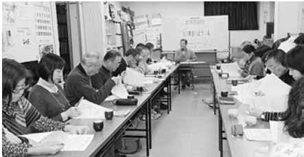
パブリックコメントを送りました

介護保険学習会開く 去る12月24日介護保険の学習会を行いました。参加者は19名、特養ホームの入居に必要な13点の根拠など実態とかけ離れた点や話題となりしました。保険料の設定も実質15段階になっている点など評価できる点もあるがそれでも保険料負担は重くなっていることは問題です。私たち区民の意見をどんどん寄せ合って介護保険の改善につなげましょう。