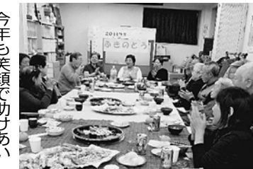
今年も笑顔で助けあい

ふきのとう 新年会 1月14日、17名の参 加で行われました。次 回は3月に学習会を予 定しています。初めて の方のご参加お待ちし ています。 ふきのとう 世話人一同