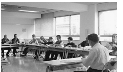
熱心に聞く参加者