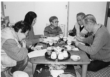
班会でもとりくみま した（金町支部・さ つき班）