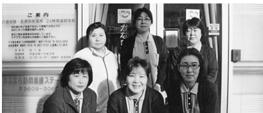
心をこめて私たちが支援します