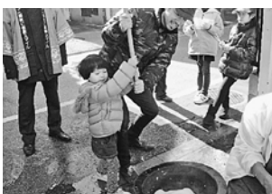
親子で参加 (篠原支部)

昨年12月18日(日)、診療所の駐輪場で恒例のお餅つきを行いました。きな粉、あんこ、からみの3種類を用意。