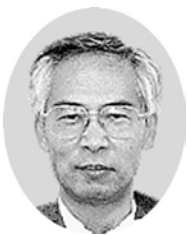
金町診療所・所長